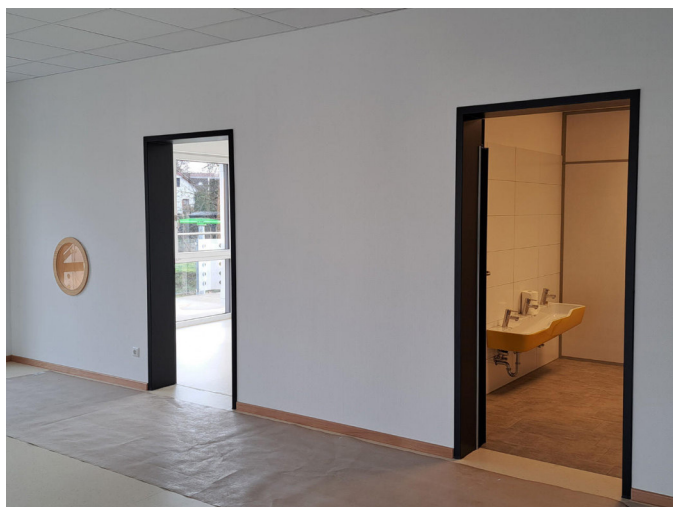
Die von der Flut zerstörte KITA in Kirspenich ist inzwischen rundum saniert.

„Inzwischen ist es 18 Monate her, dass Starkregen und Flut in Bad Münstereifel und den Ortschaften große Schäden angerichtet ha-